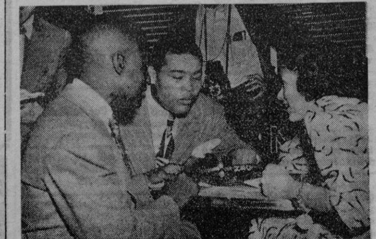
El Campeón Mundial de Boxeo Joe Louis, ha abierto un restaurante y club nocturno en Harlem, el barrio negro de Nueva York. Aparece en la foto, con el famoso bailarín negro Robinson, mientras una «reportera» le hace una entrevista.