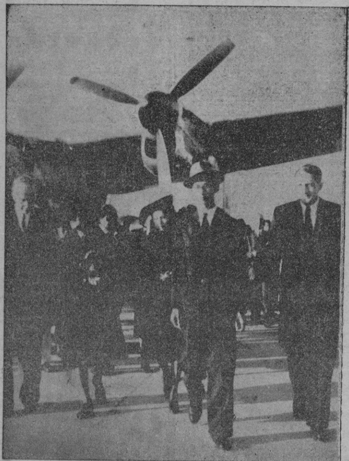
El nuevo Rey de Siam, Fumifo Adundet, hermano de Ananda Maydol, asesinado en su palacio, a su llegada a Suiza con su madre y séquito. Fumifo Adundet va a ampliar estudios en una Universidad suiza