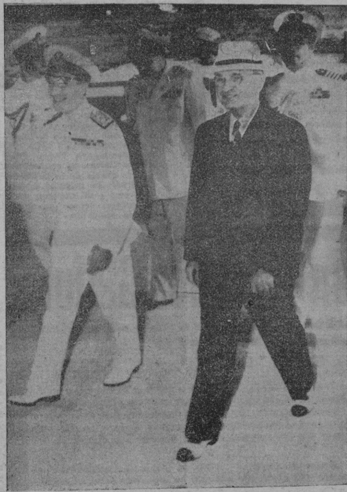
Hamilton. — El Presidente desembarca en el Bermuda Yacht Club, acompañado del Almirante Leatham, a la izquierda, y de sus ayudantes.