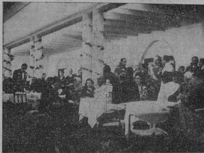
S. E. el Jefe del Estado acompañado de su esposa y otras personalidades durante la fiesta organizada por el casino de La Coruña, en su parque de Juan Florez.