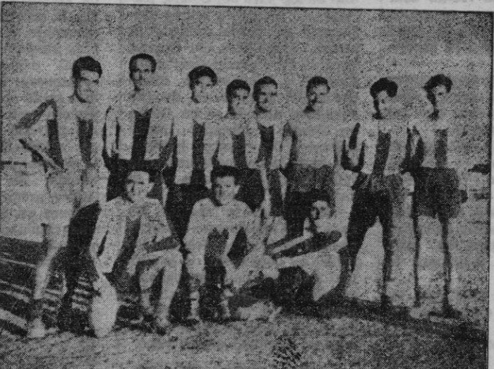
Equipo que el Atlético Baleares presentará el próximo domingo contra el «Sueca», en el partido inaugural de Liga

Estuvimos el miércoles por la tarde en el entrenamiento. Estuvimos ayer por la tarde en el entrenamiento. La mayoría de jugadores ya se hallan muy bien preparados y estamos seguros que en ellos no se notará el cansancio, como suele suceder con muchos jugadores al principio de temporada.