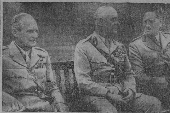
El Mariscal de Campo Vizconde de Alamein, «Monty», como es conocido popularmente visitó recientemente la India. Aquí le vemos en compañía del Virrey de la India, General Lord Wavell y del Jefe de las fuerzas armadas británicas Sir Claude Auchinleck