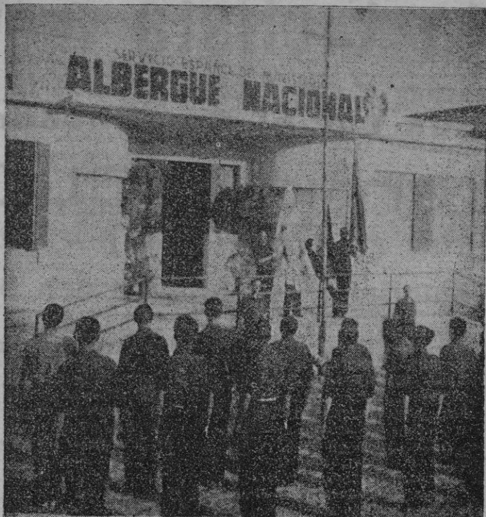
Momento de arriar la bandera ante el Albergue

En el Albergue del S. E. M. instalado en el Caserío del Arenal, pasan una serie de días un grupo de cincuenta Maestros Nacionales de todos los confines de España.