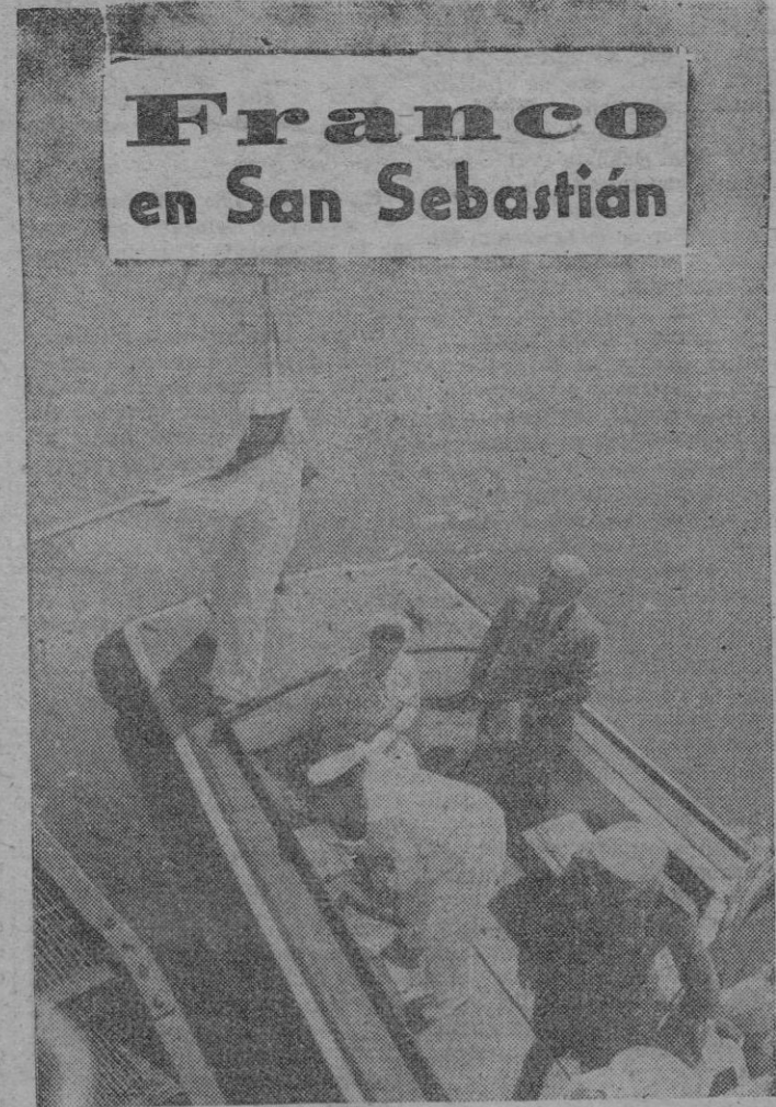
S. E. el Jefe del Estado y su esposa, a bordo de la gasolinera en la que recorrieron la bahía