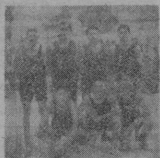
C. D. PATRIA

El próximo domingo en el campo del C. D. Hispania en el Vivero, se celebrará el encuen-