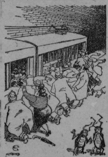
ASÍ NOS RECOMENDAN, PUES ES ÚTIL, INFERIR NADA, PORQUE VOSOS USAN AGUA DE COLONIA CRUZ VERDE.