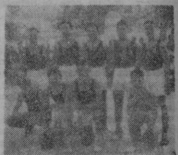
C. D. HISPANIA

al Vivero. Un encuentro Hispania-Patria, no puede despreciarse.