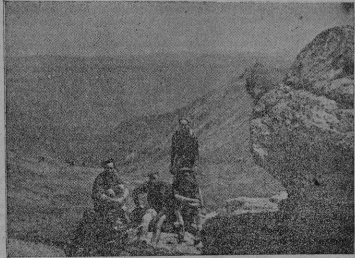
Muchachos del Frente de Juventudes ante el bello paisaje soriano

Ofrece además el volumen que nos ocupa. Dibujos alegóricos, datos gráficos de Campeonatos y Trofeos y tablas sinópticas, que le hacen muy interesante e instructivo para quienes se preocupan de cuanto afecta a educación física, deporte castrense y competiciones Regimentales, Regionales y Nacionales.