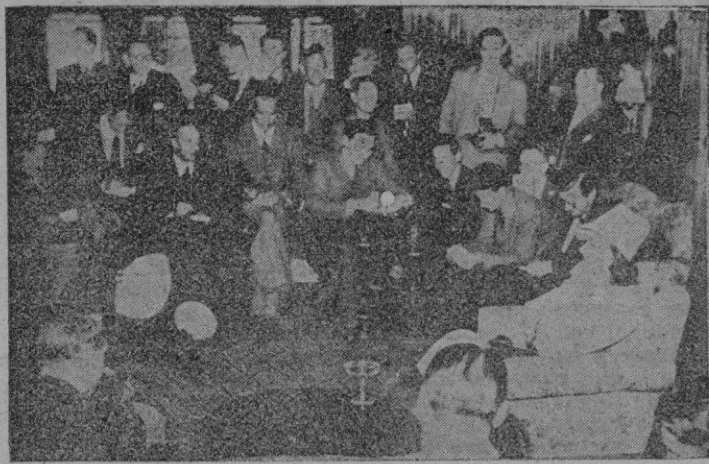
La famosa estrella sueca a su llegada a Gethemburgo el día 17 de Julio, concede una entrevista a sus compatriotas periodistas