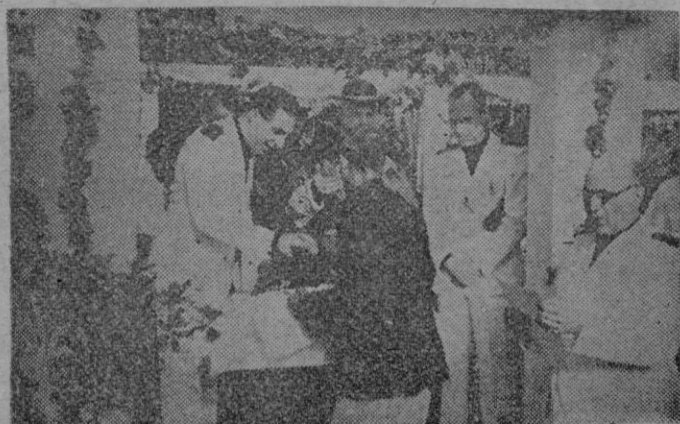
El Gobernador Civil de Málaga entrega a un pescador las llaves de vivienda ultrabarata que el Estado español le ha concedido por el mínimo alquiler de 5 pesetas mensuales

Viviendas por cinco pesetas mensuales en Málaga