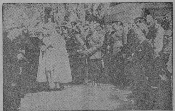
Aquí lo vemos presidiendo la bendición de las lápidas que recuerdan la gloriosa gesta de Brunete en el momento de la entrega del nuevo pueblo a su vecindario