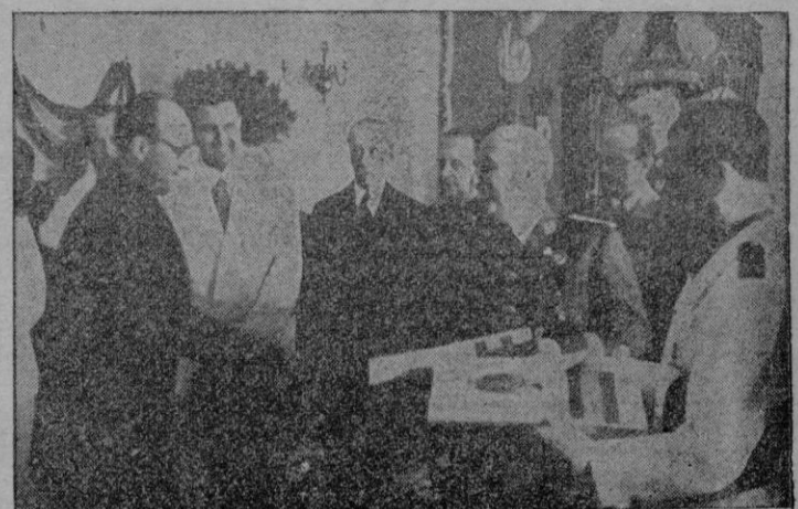
y en la entrega de los premios a las Empresas y productores ejemplares durante su estancia en Brunete