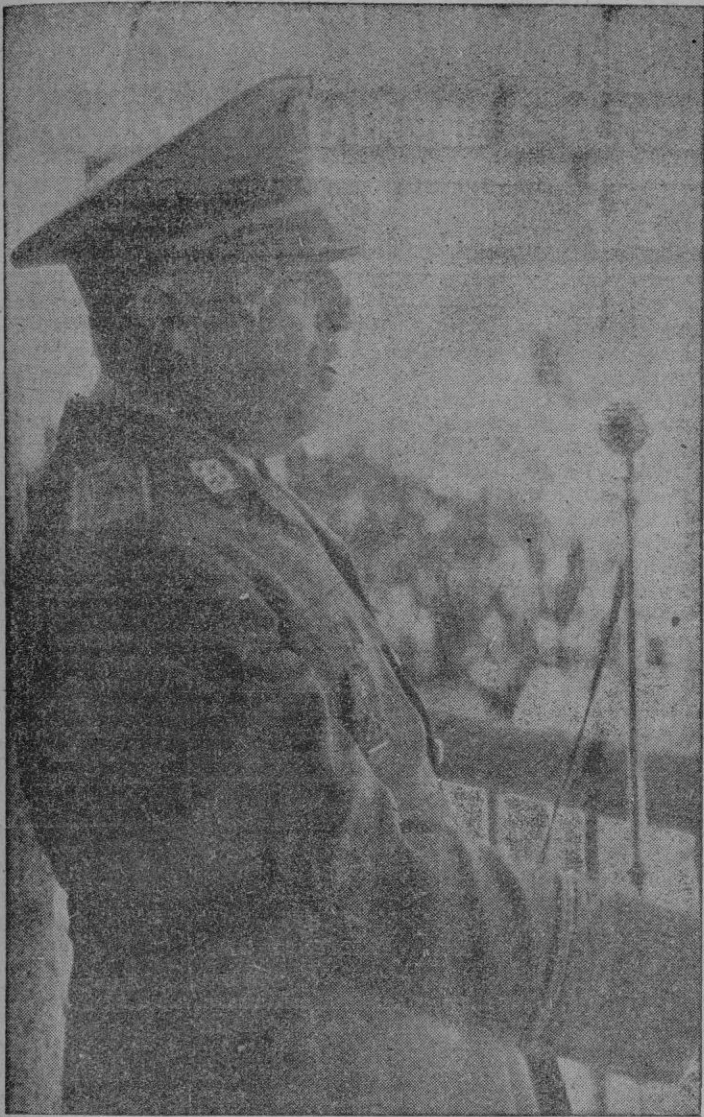
S. E. el jefe del Estado que presidió los actos de la entrega del nuevo pueblo de Brunete, durante su discurso pronunciado en el balcón del Ayuntamiento

AÑO VIII : : : NUMERO 2.083 PRECIO 40 CENTIMOS Suscripción mensual: 8 pesetas