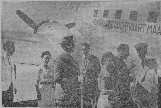
El Ministro de Holanda en España señor Teppoma conversa con pilotos y pasajeros del aparato de la Real Compañía Holandesa de Líneas Aéreas que ha inaugurado la nueva línea Amsterdam-Ginebra-Madrid-Lisboa.

En estos meses que acaban de transcurrir hemos podido observar como han ido tomando forma concreta los diversos planes que abrigaban las grandes compañías mundiales de aviación para enlazar entre sí a los diversos países. Nuestro país, situado por gracia especial en un punto geográfico de evidente estrategia ha sido tomado como punto obligado de paso por muchas de esas líneas transcontinentales y europeas, y así hemos visto como primero la holandesa K.L.M. la inglesa norteamericana, suiza y sueca, han extendido sus redes hacia Madrid. El aeropuerto de Barajas se ha transformado y un ir y venir incesante de aviones le da el aspecto de estación aérea mundial.