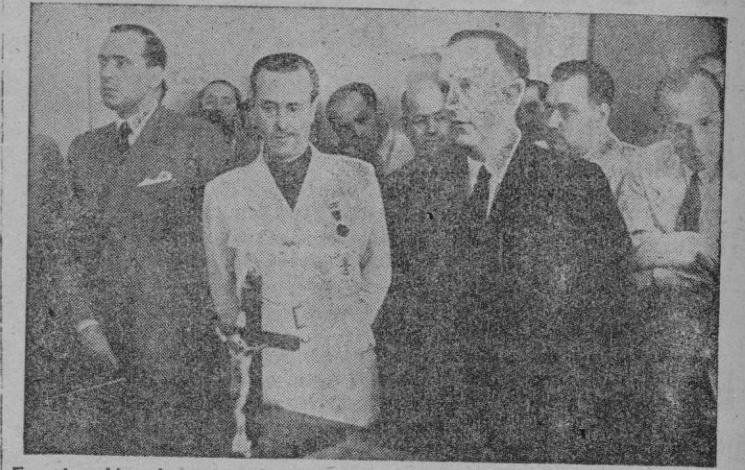
En el salón de actos de la Delegación Nacional de Sindicatos, el Ministro de Justicia señor Fernández Cuesta impone la Gran Cruz de San Raimundo de Peñafort al Delegado Nacional Sr. Sanz Orrio