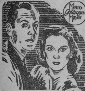
Robert MONTGOMERY y Rosalind RUSSELL

UNA descabellada comedia po- liciaca con intérpretes de categoría