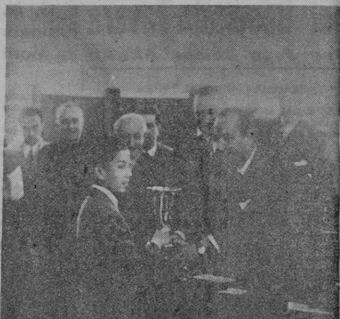
Arturito Pomar, en el momento de recibir la Copa del Campeonato de España de Ajedrez, que ganó brillantemente en el torneo de Santander.