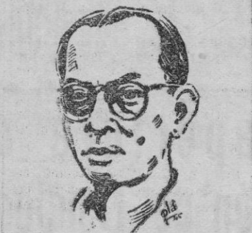
El Doctor Hatta, Ministro del Gobierno indonésico y una de las figuras principales del Movimiento para la independencia de su país, que toma parte en las esperanzadoras conversaciones en curso

Sevilla.—La investigadora norteamericana doña Alicia Gaudé ha vuelto a Sevilla a continuar sus estudios en el Archivo de Indias. La ilustre hispanista ha realizado ya una valiosa labor, pues ha descubierto numerosos documentos relacionados con el descubrimiento de América, y la labor de España en aquellas tierras.—Cifra