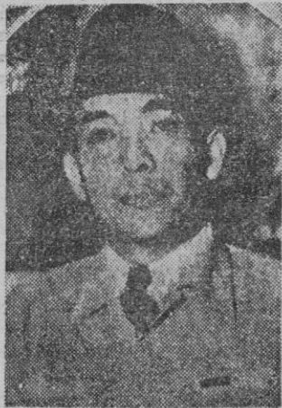
El Doctor Sukarno, Presidente de la República de Indonesia, Jefe teórico y moderado del Nacionalismo indonésico

Como consecuencia de lo que antecede, el Gobierno neerlandés