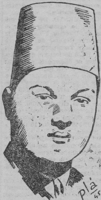
EL REY FARUK

Los tumultos y manifestaciones que están produciendo en El Cairo los estudiantes señalan una corriente antibritánica y una decisión de que el Gobierno rectifique su actitud con Gran Bretaña. El joven Rey Faruk, tan querido del pueblo egipcio, puede ser quizá el árbitro de esta tensa y delicada situación creada actualmente en su país.