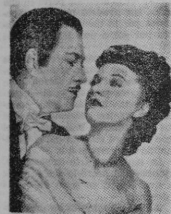
Susanna Foster y Nelson Eddy, principales intérpretes de la película.

Si tu ideal es constituir un hogar propio, a ello contribuirá notablemente un PRESTAMO NUPCIAL de los que mensualmente concede el nuevo Estado a través del Instituto Nacional de Previsión.