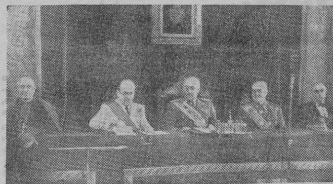
El Ministro de Educación Nacional pronuncia su discurso durante la clausura del Pleno Consejo Superior de Investigaciones Científicas, acto que fué presidido por el Caudillo.