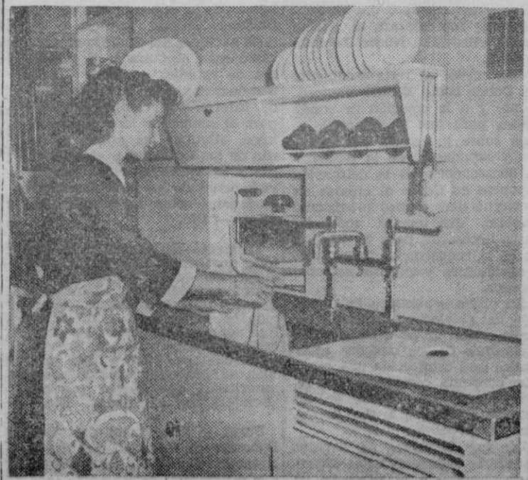
En la Exposición de Construcciones Plásticas de Londres se dan exhibiciones de material plástico para cocina, último grito para el utillaje de las amas de casa inglesas.