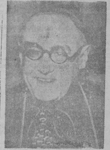
DR. PLÁ Y DENIEL

Barcelona. — Con motivo de haber sido investidos de Cardenales los doctores Plá y Deniel, y Arce, Arzobispos de Toledo y