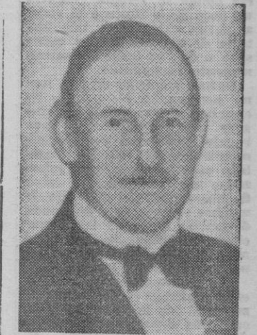
SIR VICTOR MALLET

Barcelona. — Esta tarde llegó al aeropuerto de Prat, el Embajador inglés en España, Sir Victor Mallet, que vino en un avión de la «Iberia», de la aviación española que pilotaba el Capitán Pombo.