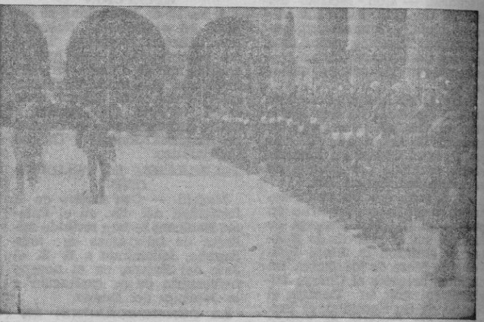
Una compañía del Regimiento de Infantería acudió al patio de Capitanía General y fué revistada por el Excmo. Sr. Capitán General de Baleares...

El desfile fué presenciado por numeroso público que se había estacionado en los alrededores del palacio de la Almudaina.