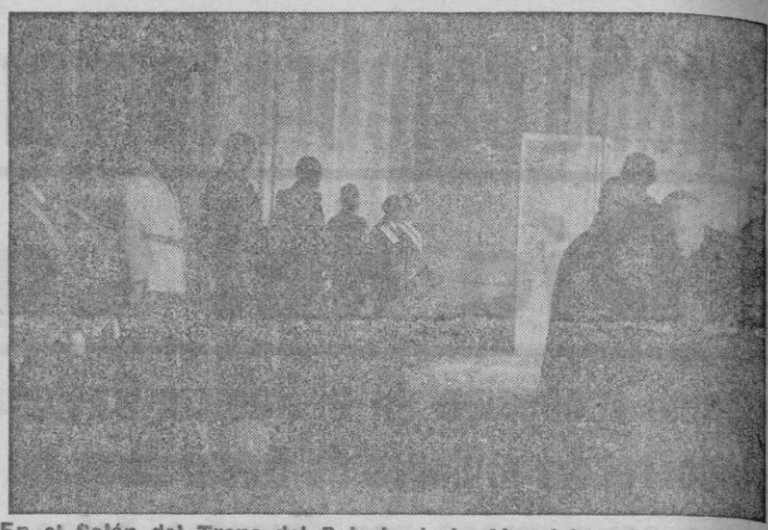
En el Salón del Trono del Palacio de la Almudaina, S. E. el Capitán General de Baleares don Salvador Muga Buhigas, recibe a las autoridades provinciales y locales...