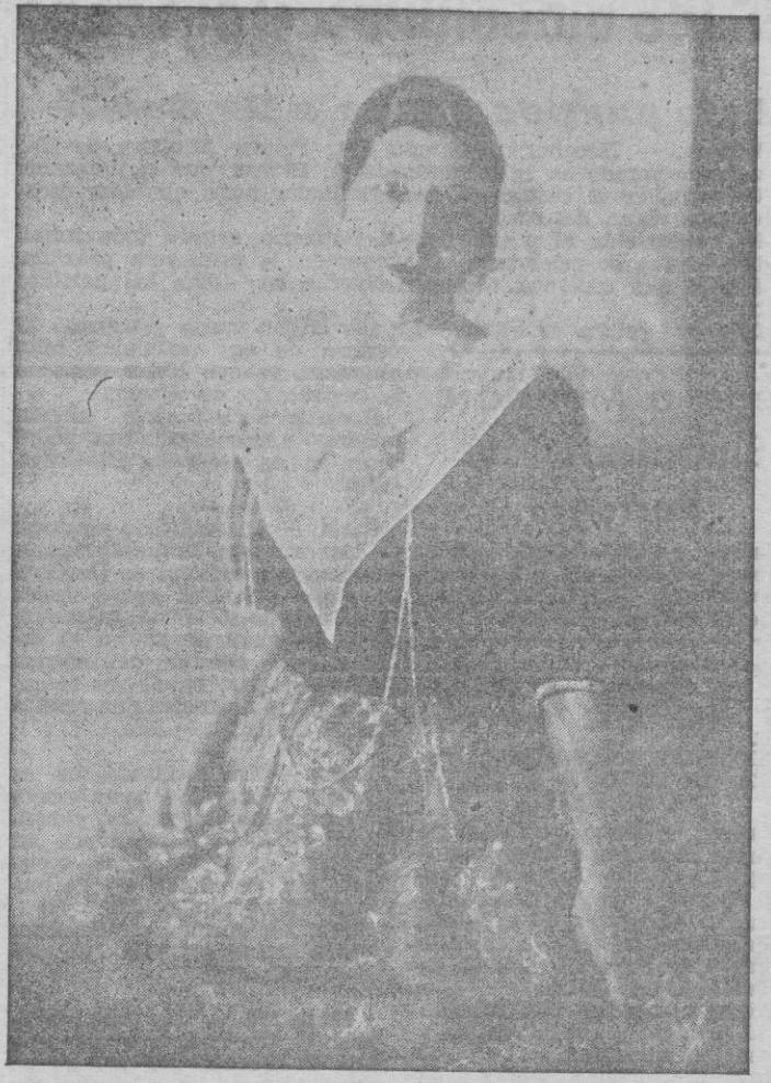
Interesante fotografía de la famosa y popular artista española que acaba de fallecer en Nueva York. Esta foto de «La Argentinista», cedida por nuestro amigo el fotógrafo don Ernesto Guardia, fué obtenida por él mismo cuando la eminente bailarina estuvo en Palma, y en ella aparece vestida con nuestro traje típico