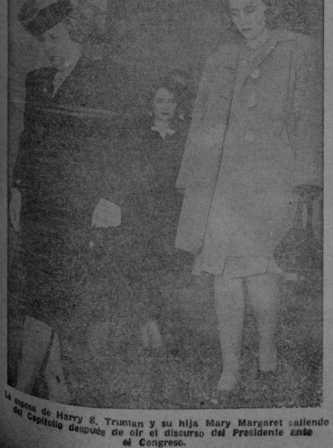
La esposa de Harry S. Truman y su hija Mary Margaret saliendo del Capitolio después de oír el discurso del Presidente ante el Congreso.