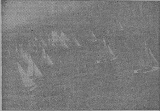
Momento de tomar la salida los treinta balandros participantes en el Campeonato de Baleares de «Snipes», en la regata del viernes

Se retiraron debido a la escasez de viento, Vedrá, Loreto VI, Galicia, Concha, Maripí, Loreto V, Maribed, Hércules y Eolo. El Altair no tomó salida.