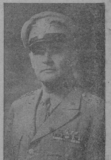
El Teniente General Barney W. Giles, Jefe de las fuerzas de caza del Ejército aéreo norteamericano en el Pacifico

BARCELONA. — Se anuncia el próximo establecimiento de una línea de navegación entre Brasil y España en buques brasileños. De momento ha sido reanudado el tráfico marítimo con Portugal. Hace días salió del puerto el trasatlántico «Pedro I» en dirección a Lisboa en rendir viaje. El servicio será prolongado más adelante hasta los puertos españoles del Mediterráneo y Atlántico.—Cifra.