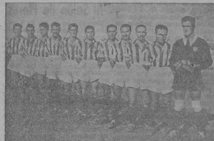
El C. D. Santañy, que al vencer en el encuentro final al Sallista de Inca, se proclamó Campeón absoluto de III Categoría regional