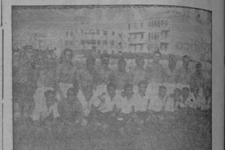
Las selecciones de peninsulares y mallorquines, momentos antes del partido