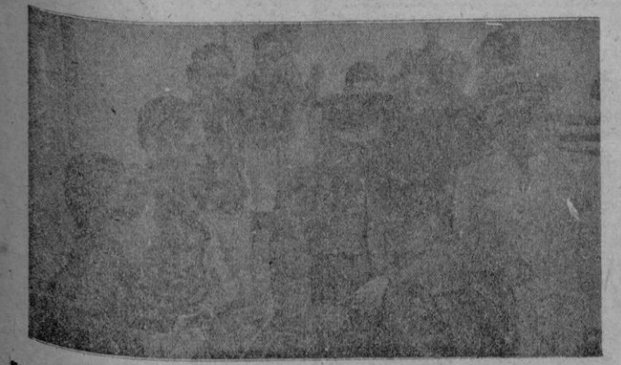
El Ministro del Aire, General Vigón, en el Campamento de Aeromodelismo de Retamares, donde tienen lugar las pruebas del II Concurso Nacional.