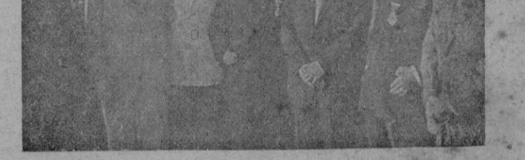
Grupo de periodistas madrileños que han sido condecorados por el Director General de Prisiones con la medalla de plata del Mérito Social Penitenciario.