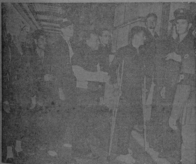
Veteranos y heridos estadounidenses han asistido a las deliberaciones de la UNGIO en San Francisco, y aquí los vemos participando en el edificio de la Opera