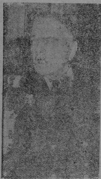
El Almirante Halsey, jefe de la Tercera Flota norteamericana, durante una Conferencia de prensa.