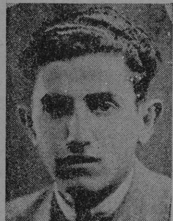
PERELLO El joven jugador del Regatas, figura destacada en el campeonato de reservas de primera categoría.

El segundo fué de características diferentes ya que hubo un poco de