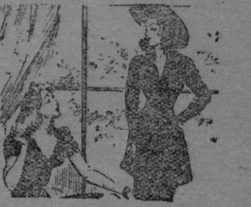
Figurate que ayer me han confundido con mi hija...