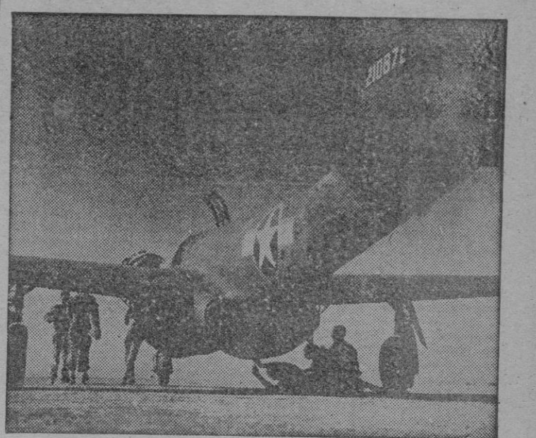
Una versión norteamericana del avión de propulsión por reacción el «Airacomet P-59A» preparándose para realizar un vuelo de prueba en una base americana.