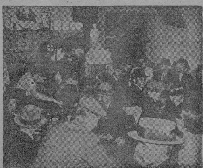
Soldados norteamericanos haciendo sus compras en un antiguo y muy frecuentado café de una vieja ciudad francesa.

En la llanura alsaciana, al norte de Colmar, nuestras fuerzas rechazaron un ataque adversario y ganaron algún terreno en un contraataque.