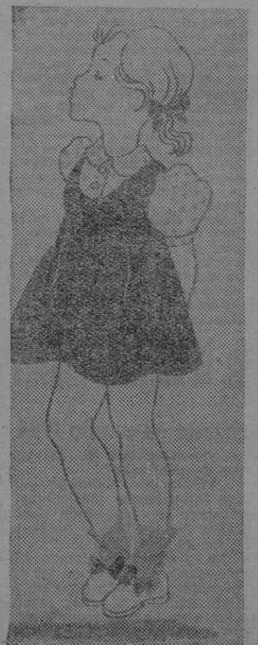
Las niñas siguen prefiriendo las muñecas