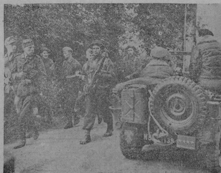
Prisioneros alemanes que marchan a retaguardia de las líneas aliadas en Francia, se cruzan con el General Montgomery que marcha hacia el frente en un «jeep».

Por falta de fluido eléctrico, dejamos de publicar buen número de últimas noticias nacionales y extranjeras, así como la crónica internacional diaria de nuestro camarada A. C.