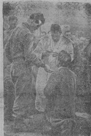
Soldados católicos norteamericanos comulgan en plena línea de fuego