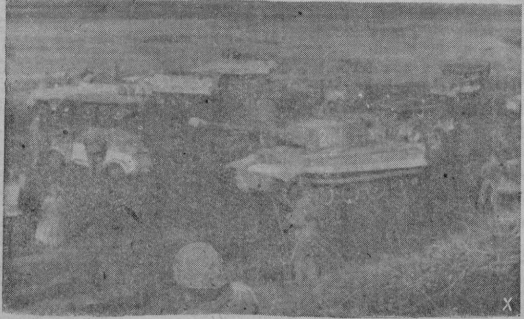
Fuerzas blindadas alemanas en un sector del frente de la cabeza de puente de Normandía, concentradas para iniciar un contraataque contra las tropas aliadas. (Primera foto recibida del escenario de la invasión)