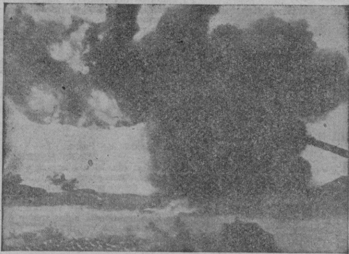
Cañón de largo alcance alemán disparando contra las unidades angloamericanas atacantes. Los duelos entre la flota aliada y las baterías costeras alemanas siguen en el primer plano de la batalla de Normandía.