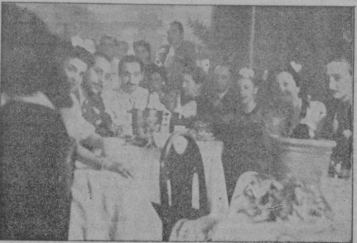
Ribas de Durán hizo estas dos fotos en las que se recogen parcialmente dos detalles de la gran animación que reinó en la Verbena de la Asociación

Brevemente tendremos que referirnos hoy a la Verbena celebrada el domingo en «Madrigal», con la que la Asociación de la Prensa inaugura sus Fiestas de verano.