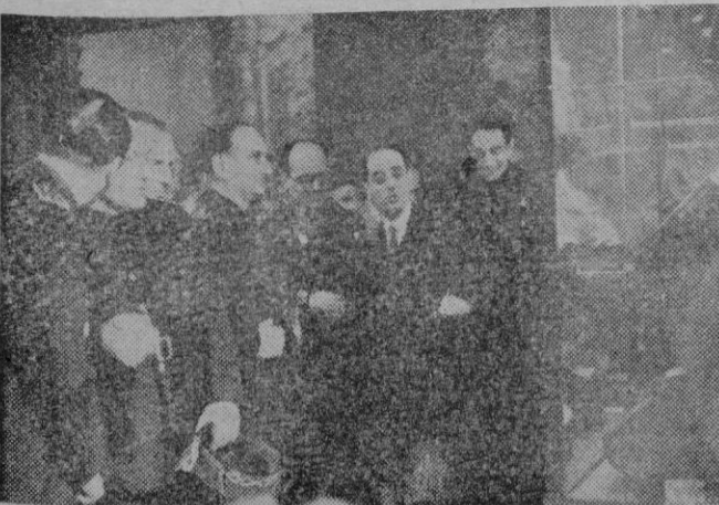
Madrid. — Los ministros Secretario del Movimiento, de Industria y Comercio, y de Educación Nacional, en la Feria del Libro.