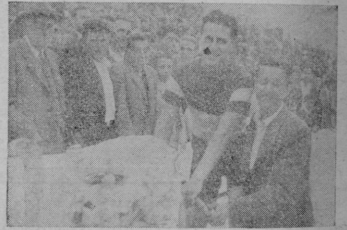
El campeón al iniciar la vuelta de honor por la pista con el ramo de flores ofrecido por el Comité de la U. V. E.