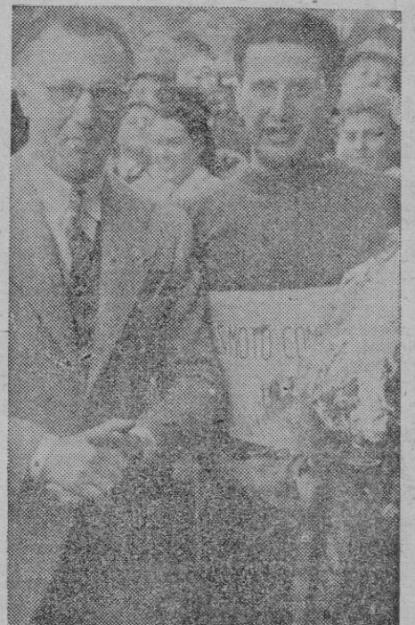
El Excmo. Señor Gobernador Civil y Jefe Provincial del Movimiento con el nuevo Campeón de España Miguel Salom.

Desde aquellos momentos Salom se convierte en favorito de la carrera. Demostró Miguel Salom que este año puede llegar allí donde quiera. Hay en él madera