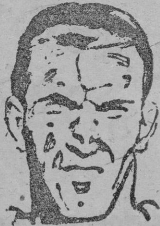
Paquirri tuvo una gran actuación en Chamartín.

El Constancia llegó verde a la eliminatoria. Fué meritorio el es-