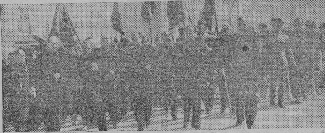
El Ministro Secretario general del Movimiento, camarada Arrese, a su llegada a Murcia, donde fué objeto de un clamoroso recibimiento.