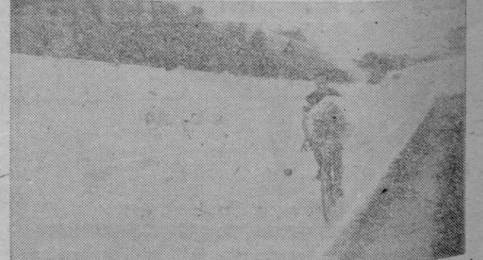
Entre aclamaciones Miguel Salom da la vuelta de honor a la pista ostentando la camiseta de campeón y un soberbio ramo de flores.