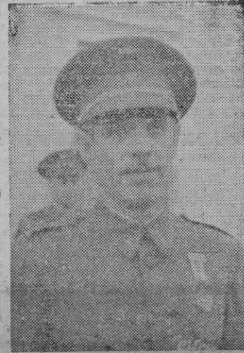
EL MINISTRO DEL EJERCITO

Seguidamente las fuerzas del Regimiento de Transmisiones desfilaron ante los Ministros y Auto-