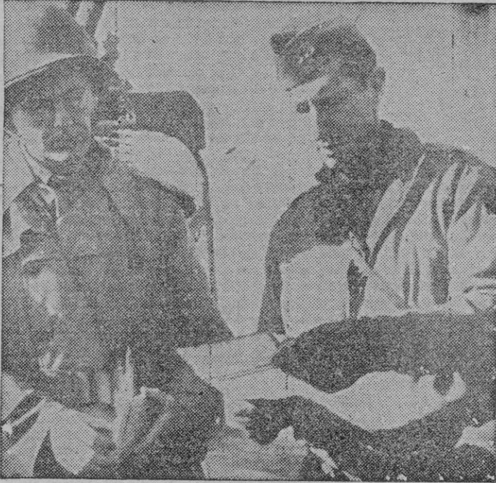
El Teniente General Clark leyendo los despachos de los Jefes de operaciones en la costa occidental italiana y del sector de Cassino.