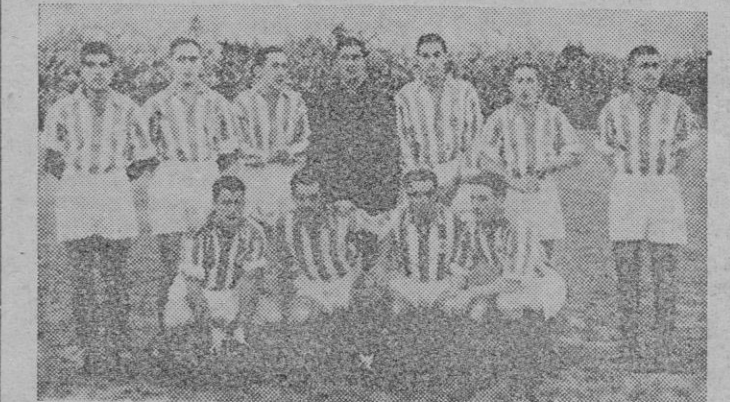
La Real Sociedad que actuará la próxima temporada en II División.

Al dar la vuelta de honor por la pista, estalló otra cariñosísima