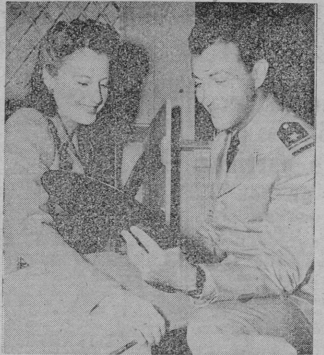
Barbara Stanwyck y el hoy teniente de la Marina Robert Taylor

Y otra vez, en contra de su deseo, Charlie Chaplin vuelve a la actualidad norteamericana, cuando desearía pasar inadvertido y que le dejaran tranquilamente casarse con esa gentilísima chica de dieciocho años encargada de hacerle olvidar todo lo demás.