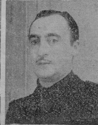
MIGUEL PRIMO DE RIVERA

Experimental. Después dirigióse a Granollers donde fué recibido por el Alcalde, Gobernador Militar y otras autoridades. Rindiéndole honores una Bateria del Re-