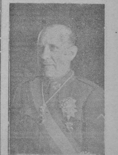
CONDE DE JORDANA

Ha declarado nuestro Ministro de Asuntos Exteriores