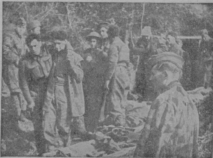
Aquí vemos a un grupo de prisioneros angloamericanos capturados por las tropas alemanas conduciendo a sus camaradas heridos a un puesto sanitario.