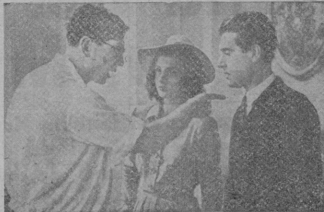
El Director y los intérpretes de «Doce lunas de miel»

por tipos que no existieron jamás; «rosas» quiere decir tolerancia a cuanto por conducir a un buen fin, a un amable y superficial acontecer, a una acción sin hondos problemas, se nos ofrezca aun sin el menor raso de humanidad en los personajes, ni de vida en el asunto.