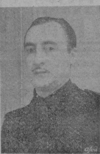
MIGUEL PRIMO DE RIVERA

HABLA EL MINISTRO DE AGRICULTURA A continuación pronuncia un discurso el Ministro de Agricultura. Comenzó expresando su agrade-