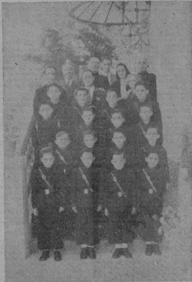
Un grupo de alumnos de la Escuela-Hogar de S. Isidoro.

las nuevas normas de edificación, y tres plantas. En ningún momento se dá hoy ni se dará mañana la sensación de que nuestra Escuela Hogar es un asilo o un orfanato; no lo es; es una residencia, un colegio, un hogar, donde se educa a los jóvenes y se les prepara y dispone para encararse con la vida, para abrir