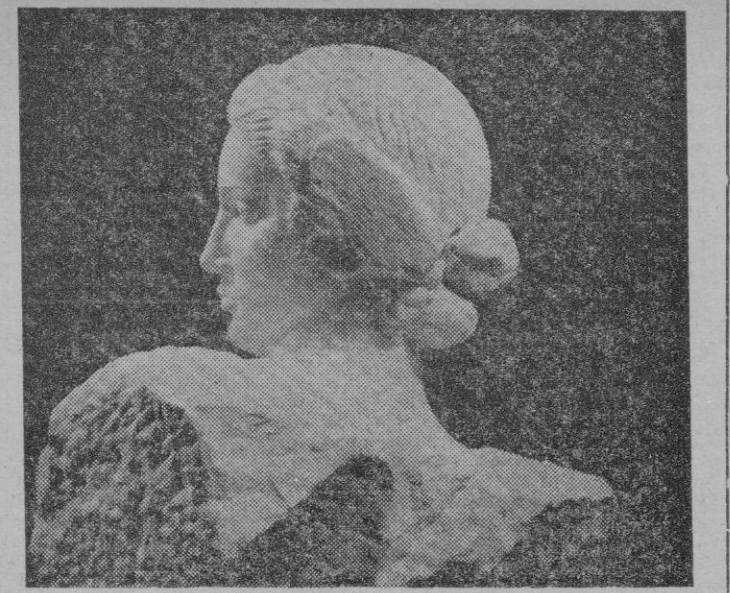
BUSTO, por Borrell-Nicolau.

En la «Estatua femenina a mayor tamaño» (piedra de Santany) de perfil enérgico y línea opulen-