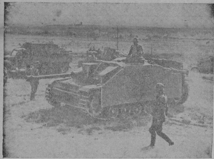
Tanques alemanes que operan en un sector del Donetz dispuestos para entrar en acción.