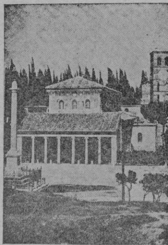
La Basílica de San Lorenzo antes del bombardeo