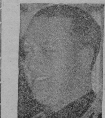
Vichy.—El Conde Galeazzo Ciano, ex Ministro de Negocios Extranjeros de Italia, ha sido liberado por los alemanes. Así lo ha dicho la radio de Vichy en una de sus emisiones.—Efe.