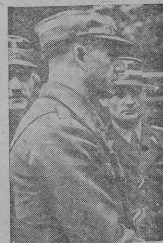
El Comandante Otto Skorzeny —«S. S. Sturmabführer»— liberador de Mussolini, en el Cuartel General del Führer.