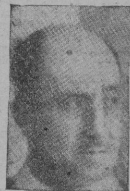
Ministro de Marina