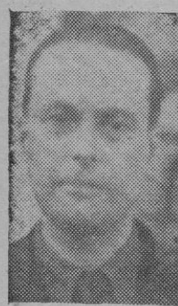
Ministro de Gobernación.

Torrejavega.—El Ministro de la Gobernación, Blas Pérez, llegó procedente de Asturias a las diez y cuarto de ayer. En el Ayuntamiento se interesó por los problemas locales que le expuso el Alcalde y ante las aclamaciones del público el Ministro salió al balcón y dirigió unas palabras en las que dijo: