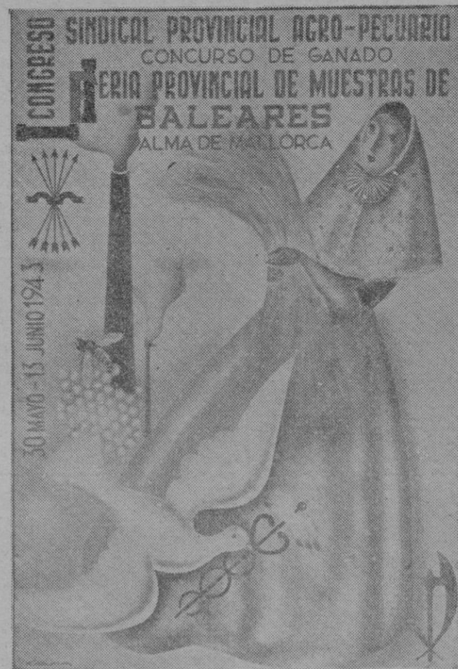
Uno de los carteles que han sido confeccionados anunciadores del I Congreso Sindical Provincial agro-pecuario que ha de celebrarse en esta capital desde el 30 de mayo al 13 de junio, obra de nuestro colaborador «XAM»