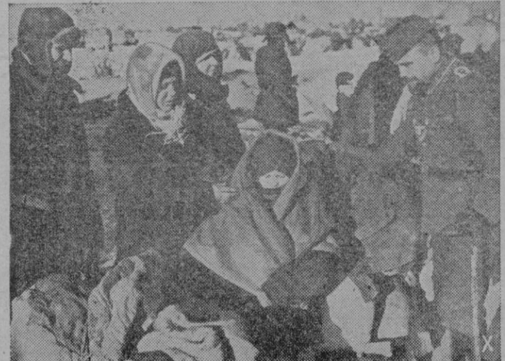
La población civil rusa vuelve otra vez a sus pueblos después de la victoriosa contraofensiva alemana en el frente meridional del Este