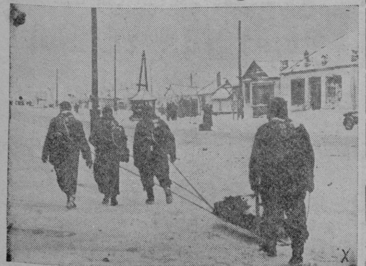
Soldados alemanes de Infantería pasan un pueblo soviético camino de su posición, en la línea del Lago Ladoga

WASHINGTON. — LOS ALIADOS HAN PERDIDO MAS BARCOS MERCANTES EN MARZO QUE EN FEBRERO EN EL ATLANTICO DEBIDO A LA INTENSIFICACION DE LA CAMPAÑA SUBMARINA DEL EJE, HA DECLARADO EL MINISTRO DE MARINA, KNOX. — Efe.