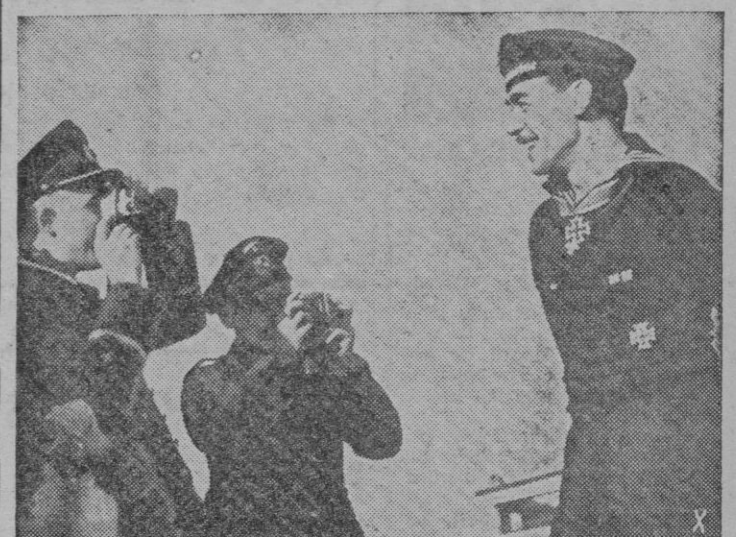
El primer soldado de la Marina de Guerra alemana que ha sido condecorado con la Cruz de Caballero por sus méritos de campaña a bordo de un buque de transporte en servicio en el Mediterráneo