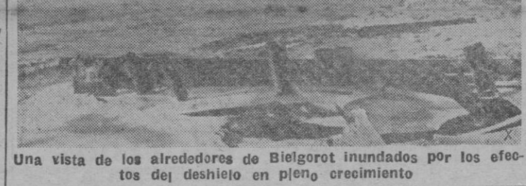
Una vista de los alrededores de Bielgorot inundados por los efectos del deshielo en pleno crecimiento

Coruña. — Por el buque «Neuvo Neptuno» fué vista una mina a la deriva a la altura de cabo Finisterre a 9 millas de distancia aproximadamente. Esto ha sido comunicado a las autoridades de marina para que esta a su vez lo haga saber a los navegantes. — Cifra.