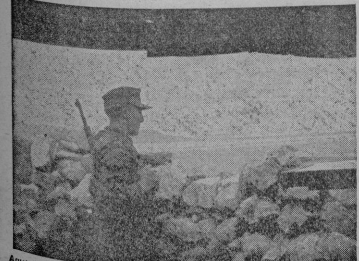
Aquí vemos uno de los puestos de observación y vigilancia que a cientos siguen las costas mediterráneas ocupadas por el Ejército alemán