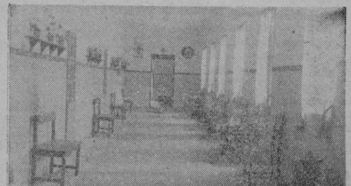
Sala del Hogar-Guardería de Muro recientemente inaugurado. Muestra del buen gusto que presenta la instalación toda de la nueva fundación de «Auxilio Social»