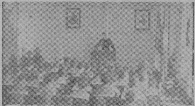
Camaradas del Frente de Juventudes durante la celebración del acto con que se conmemoró la festividad del 2 de Mayo.