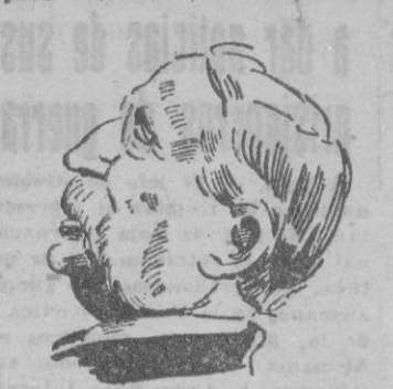
Léon Blum, acusado del proceso de Riom destacado como creador y mantenedor del Frente Popular francés.

ponde que esta medida no provocó ninguna objeción a los jefes militares de aqueh la época. Un poco más tarde, declara, de los