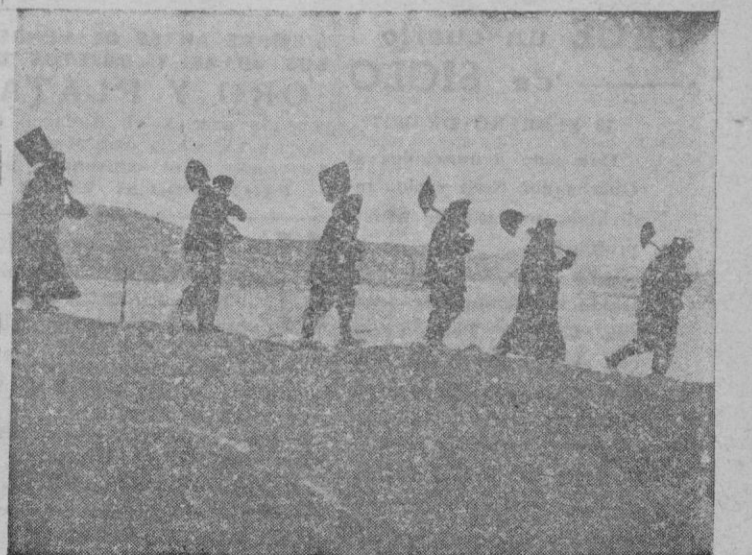
FRENTE DEL ESTE. Aquí vemos a una patrulla de limpieza de carreteras bloqueadas por la nieve, regresando al campamento después de su labor diaria.