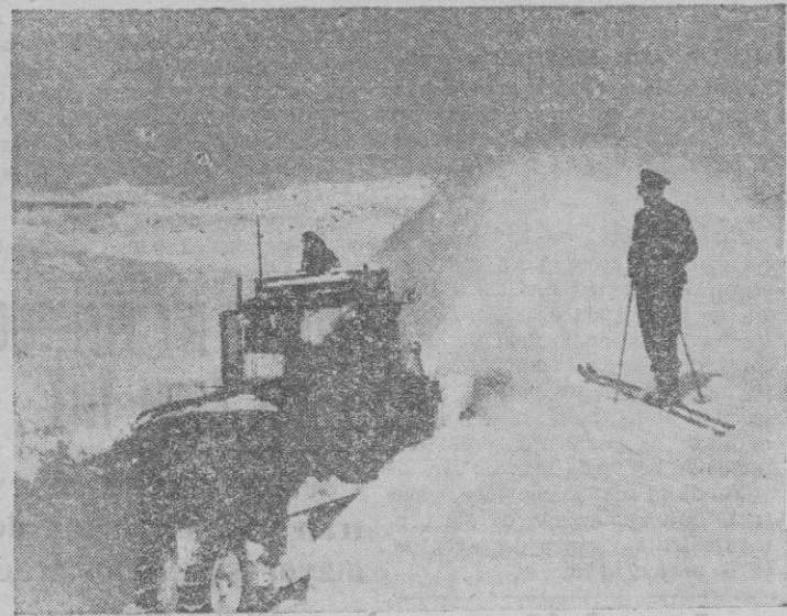
Para combatir las dificultades que la nieve crea en las comunicaciones de Rusia, el Ejército alemán tiene grupos y máquinas especiales. He aquí a un limpianeieves, actuando intensamente