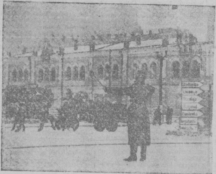
Una vista de la ciudad de Charkow sobre la que cae una buena nevada. Como se ve, soldados alemanes son encargados del tráfico en las calles.