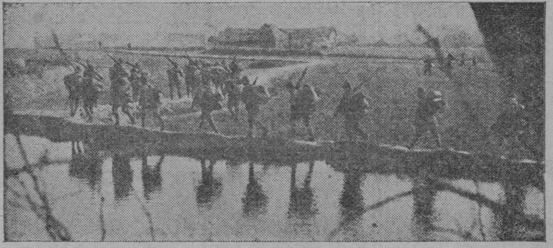
Soldados japoneses avanzan hacia sus objetivos en las provincias de la Malasia