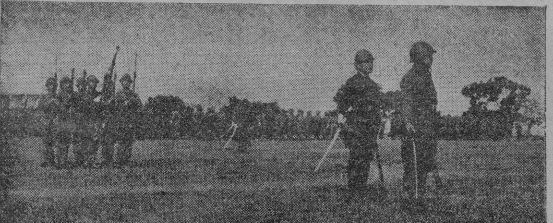
Una parada militar de las fuerzas japonesas de ocupación en Tailandia