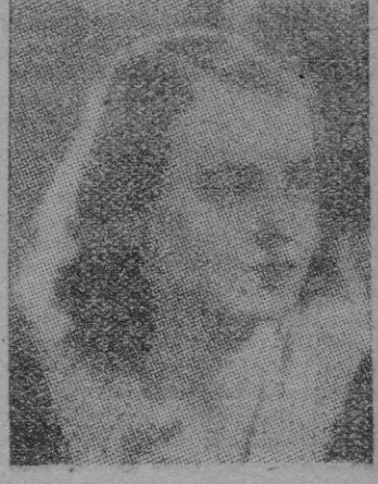
Ingrid Bergman, actriz alemana, principal figura de «Las cuatro camaradas».

«Cancionera» es uno de los inmediatos estrenos que veremos en Palma.