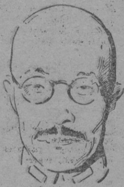
Tokio. — El Primer Ministro General Tojo ha dirigido un llamamiento por radio a la nación

Ha dicho TOJO por radio a la nación nipona