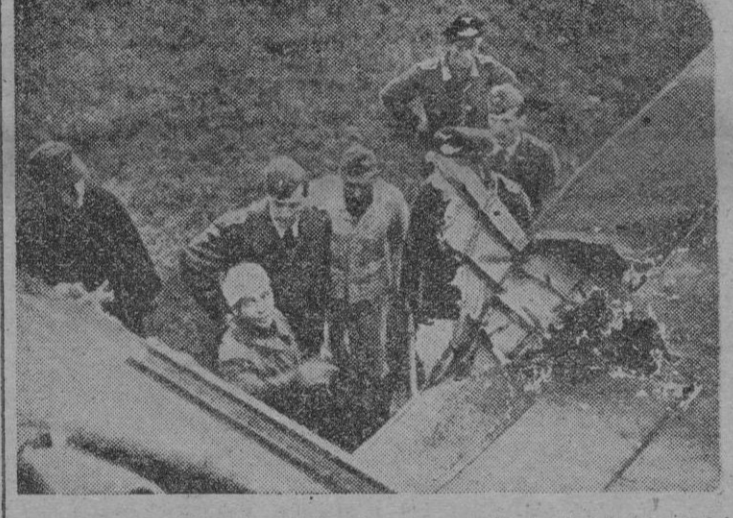
Esta foto nos muestra el impacto que recibió un bombardero del Reich durante un ataque a la línea férrea Murmansk, resultando uno de sus tripulantes herido, pero en contra de todo, el avión pudo llegar a su base