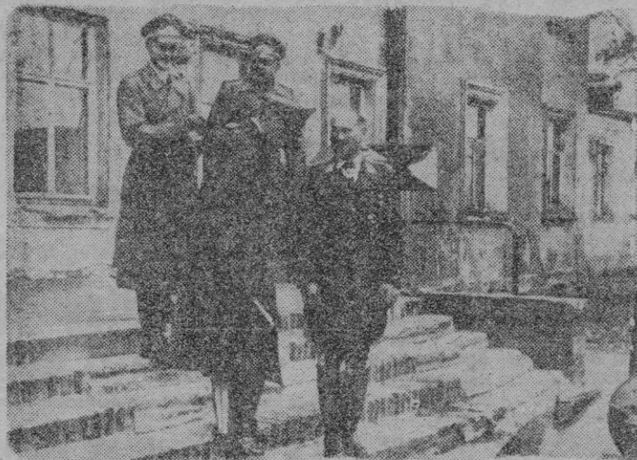
El Mariscal Kesserling, que manda un Cuerpo Aéreo en Rusia, visita al General Loerzer, jefe de un sector aéreo del frente Central. La foto nos muestra el momento de la despedida después de un cambio de impresiones sobre la marcha de las operaciones.