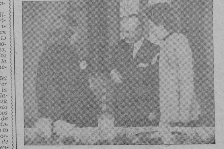
Las señoritas que postularon a favor de la Cruz Roja española ofrecen banderitas al Presidente de la Junta Política y Ministro de Asuntos Exteriores camarada Serrano Suñer.