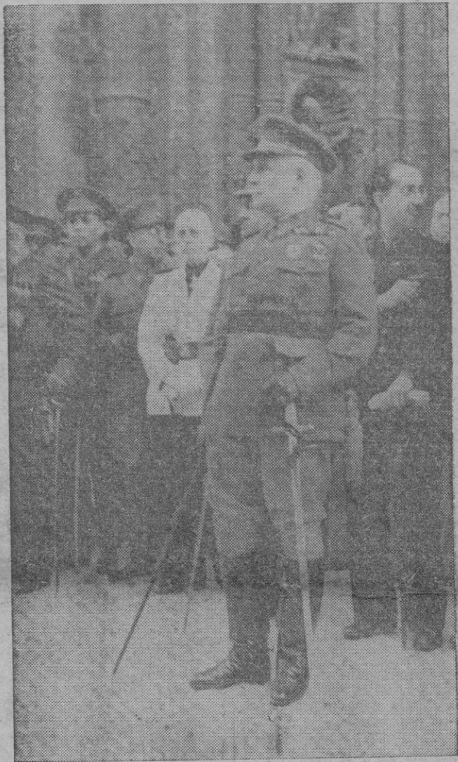
El Excmo. Sr. Capitán General de Baleares, con Autoridades, Jefes Militares y Jerarquías, presencia el desfile de las fuerzas que le rindieron honores

Es la mejor en su género realizada desde hace siglos