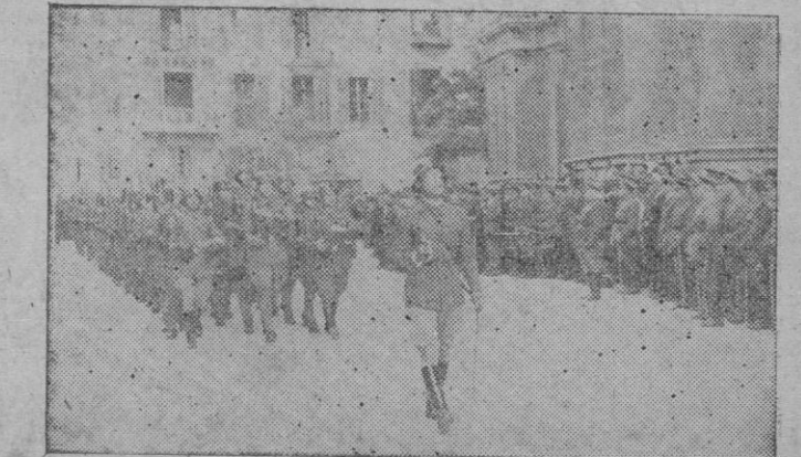
Las tropas de Infantería inician el desfile ante el Capitán General y autoridades