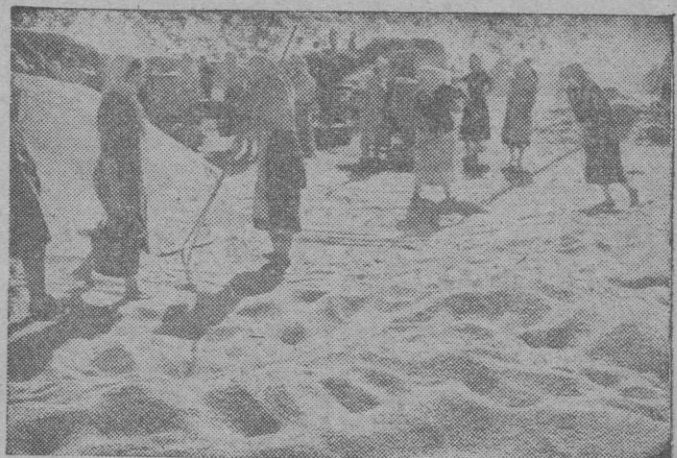
En la zona conquistada por las victoriosas armas del Eje, en la Rusia del Sur, se realizan ya los trabajos de recolección y molturación del trigo que será el pan de Europa