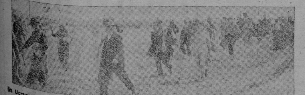
En Ucrania: La población liberada del terror y la muerte comunista, tras el victorioso avance alemán retorna a sus hogares a menudo devastados por los dirigentes soviéticos