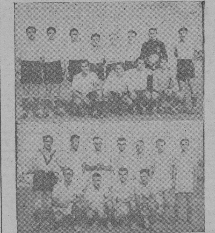
Los equipos del Constancia y de la Selección que ayer nos obsequiaron con un partido de verano, con un tanteo abultado y con una decepcionante exhibición de los campeones en el terreno de «Buenos Aires»

Bonet se alinearon de la siguiente forma: Selección.—Oliver; Amengual, Mezquida; Matas, Serra, Genovard; Patro, Olivá, Arnau, Albellá (segundo tiempo Vidal), y Pueyo.