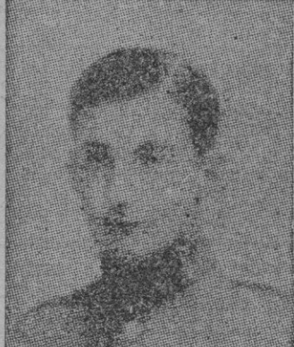
Camarada Fernando Primo de Rivera ¡Presente!

Trágica noche del 22 de Agosto de 1936. Por amar a la Patria fueron asesinados cobardemente en la Cárcel Modelo españoles indefensos entonces y ejemplares siempre. Julio Ruiz de Alda y Fernando Primo de Rivera estaban entre ellos. Julio y Fernando, amigo, hermano, camaradas de José Antonio, iguales en la avanzada de la profecía y el peligro, cayeron para más gloria de España y de la Falange. Cayeron sin poder defenderlas a golpes o a tiros, pero adivinando ya el amanecer que habían prometido a las gentes españolas.