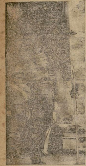
S. E. el Generalísimo durante su discurso en el acto celebrado con motivo de la entrega de los despachos a los Tenientes del Ejército

Oviledo. — La Diputación se ha reunido para tratar del traslado de los restos de don Armande Palacio Valdés, desde Madrid al Avilés.