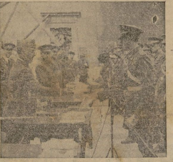
El Caudillo entrega los despachos a los Tenientes del Ejército

Madres un medicamento que tu creas es ineficaz un simple purgante puede ser fatal si es usado intempestivamente.